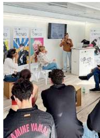
Non solo recruiting. Varie le proposte di «C'è Posto per Te»

C'è posto per te realizza molteplici attività di orientamento, organizzate in quattro aree: «Co-