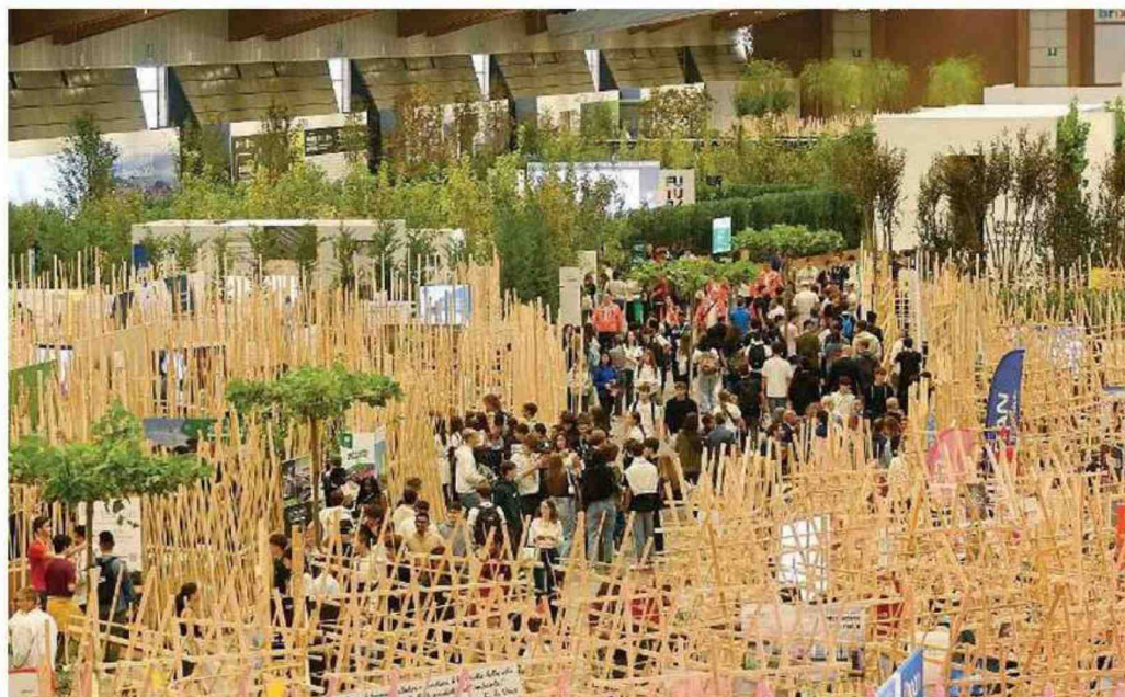
Tra gli stand. Futura Expo si è svolta al Brixia Forum dall'8 al 10 ottobre, richiamando oltre 30mila visitatori